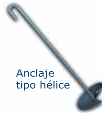
Anclaje tipo hélice