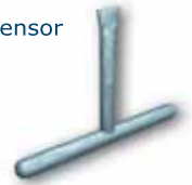
Llave para tensor Varilla