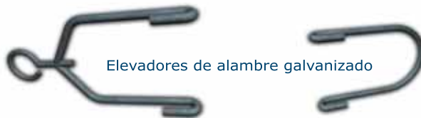
Elevadores de alambre galvanizado