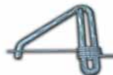
Tensor de alambre sencillo