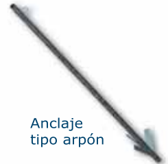
Anclaje tipo arpón