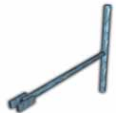
Llave para aclanje