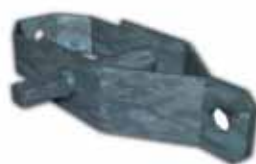
Tensor de alambre "carraca" zincado